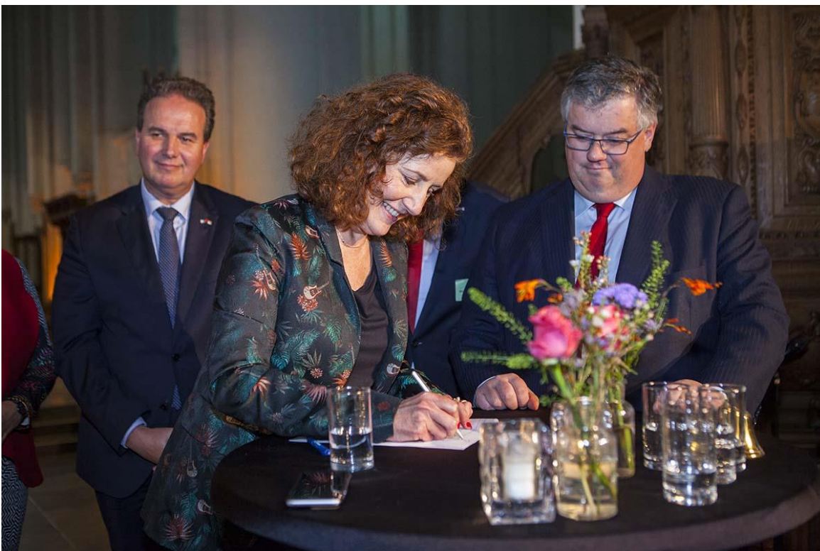
Op 10 november 2018 is een samenwerkingsovereenkomst ondertekend namens overheden, kerkeigenaren en vertegenwoordigers van erfgoed- en burgerorganisaties

Het doel van deze overeenkomst is een duurzaam toekomstperspectief te ontwikkelen voor het religieus erfgoed. Om dat te bereiken moet ál het religieuze erfgoed in samenhang gezien worden. Religieus erfgoed van alle tijden, van alle geloven, monumentaal en niet-monumentaal. In deze nieuwsbrief leest u hoe dat in uw provincie vorm krijgt.