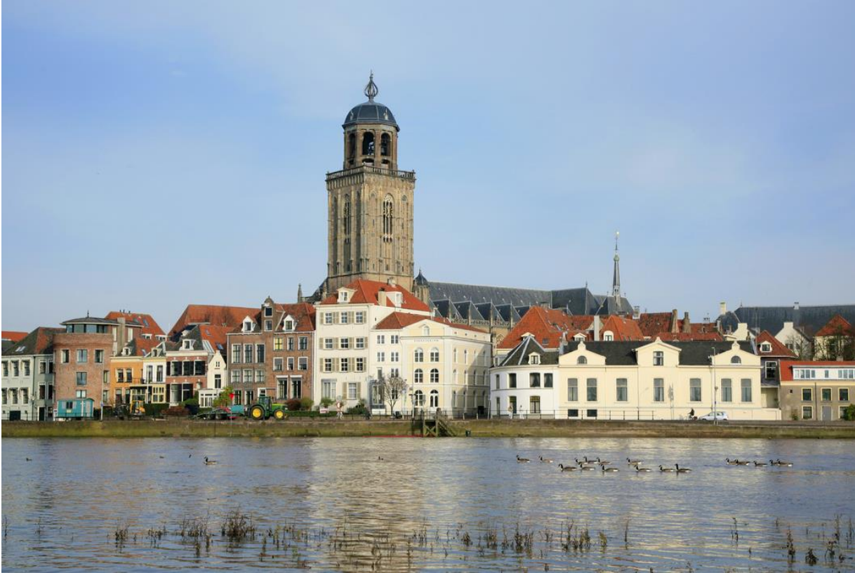
De Sint Lebuïnuskerk in Deventer kan gehuurd worden voor concerten en evenementen