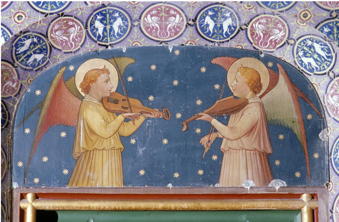
Een detail van het interieur van Onze-Lieve-Vrouw-ten-Hemelopneming (Zwolle)