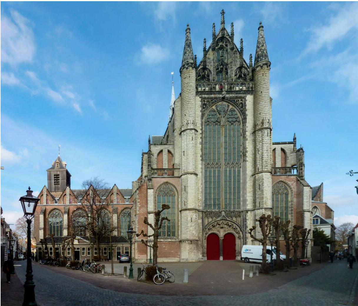
In de Hooglandse kerk in Leiden zijn elke zondag diensten, maar de kerk functioneert ook als evenementenlocatie