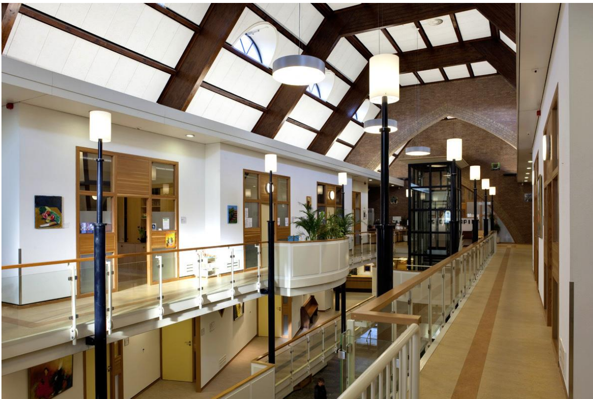
In de Sacramentskerk in Gouda is een gezondheidscentrum met fysiotherapeuten, huis- en tandartsen gerealiseerd

Het programma Toekomst Religieus Erfgoed is gericht op het realiseren van een duurzame toekomst voor kerkgebouwen. Maar achter die gebouwen gaan duizenden mensen schuil die zich met hart en ziel inzetten voor het behoud 'hun' kerken. In religieus gebruik of in nieuw gebruik. Hier treft u een gesprek met één van die mensen aan. Wilt u meer interviews lezen, klik dan door naar de website waar een keur aan verhalen terug te vinden is.