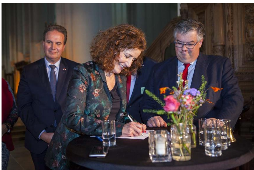
Op 10 november 2018 is een samenwerkingsovereenkomst ondertekend namens overheden, kerkeigenaren en vertegenwoordigers van erfgoed- en burgerorganisaties

Het kabinet zet actief in op dit onderwerp. Dat gaf de Minister van Onderwijs, Cultuur en Wetenschap in haar brief ‘Cultuur in een open samenleving’ van 2018 aan. Maar om deze opgave succesvol aan te pakken, is een goede samenwerking tussen verschillende partijen essentieel. Op 10 november 2018 is daarom een samenwerkingsovereenkomst ondertekend namens overheden, kerkeigenaren en vertegenwoordigers van erfgoed- en burgerorganisaties.