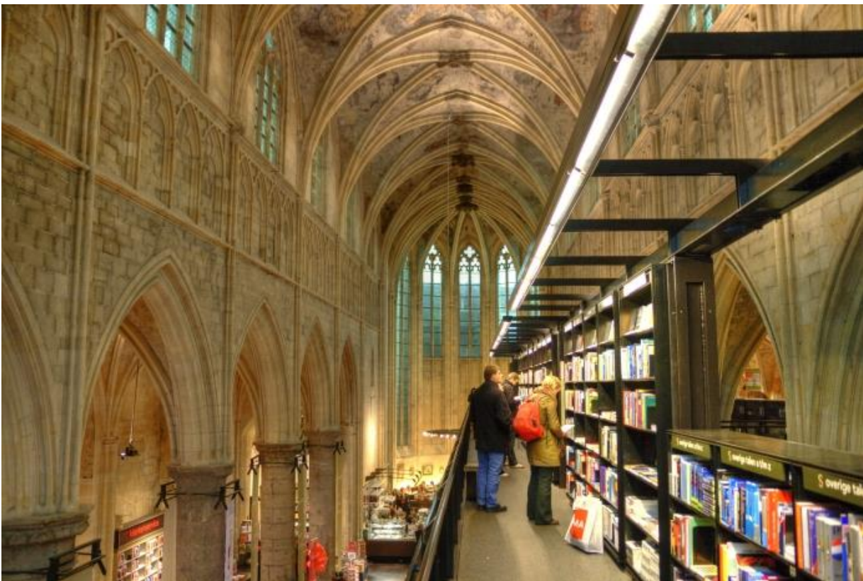
Boekhandel Dominicanen was in 2018 de best bezochte kerk van Nederland

Het programma Toekomst Religieus Erfgoed is gericht op het realiseren van een duurzame toekomst voor kerkgebouwen. Maar achter die gebouwen gaan duizenden mensen schuil die zich met hart en ziel inzetten voor het behoud 'hun' kerken. In religieus gebruik of in nieuw gebruik. Hier treft u een gesprek met één van die mensen aan. Wilt u meer interviews lezen, klik dan door naar de website waar een keur aan verhalen terug te vinden is.