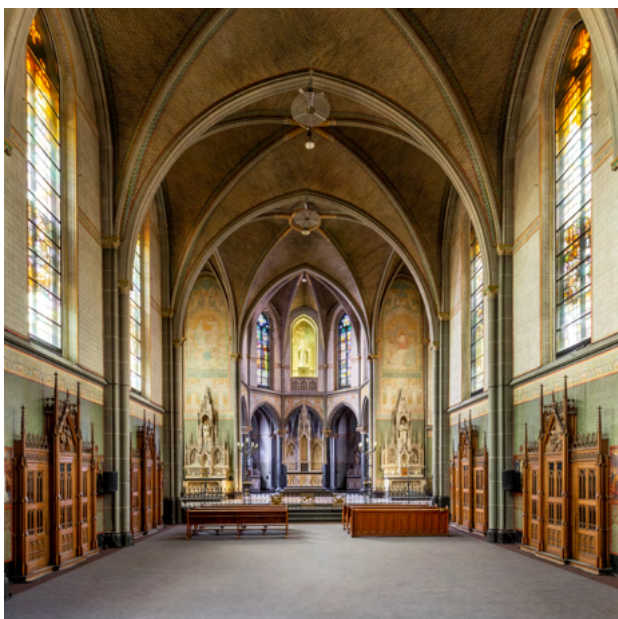
De zorgvuldig gedecoreerde kapel van de Tilburgse Missionarissen van het Heilig Hart uit 1897 met volledig bewaard gebleven beschildering van Alphons Damen uit 1914.

was dat de kapel en de sacristie in hun historische verschijningsvorm, inclusief het meubilair en de interieurafwerking, moesten worden gehandhaafd. Maar inmiddels zijn de kerkbanken verwijderd. Uiteindelijk gaat het om handelen naar gemaakte afspraken en om handhaving van de monumentale waarden. Besef van de zeldzaamheid van dit interieur is essentieel.