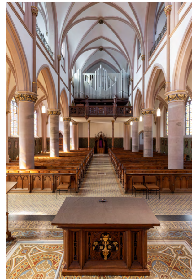
Zicht richting het orgel. De kerk is voorzien van stenen kruisribgewelven, de zuilen hebben goud geschilderde koolbladkapitelen.