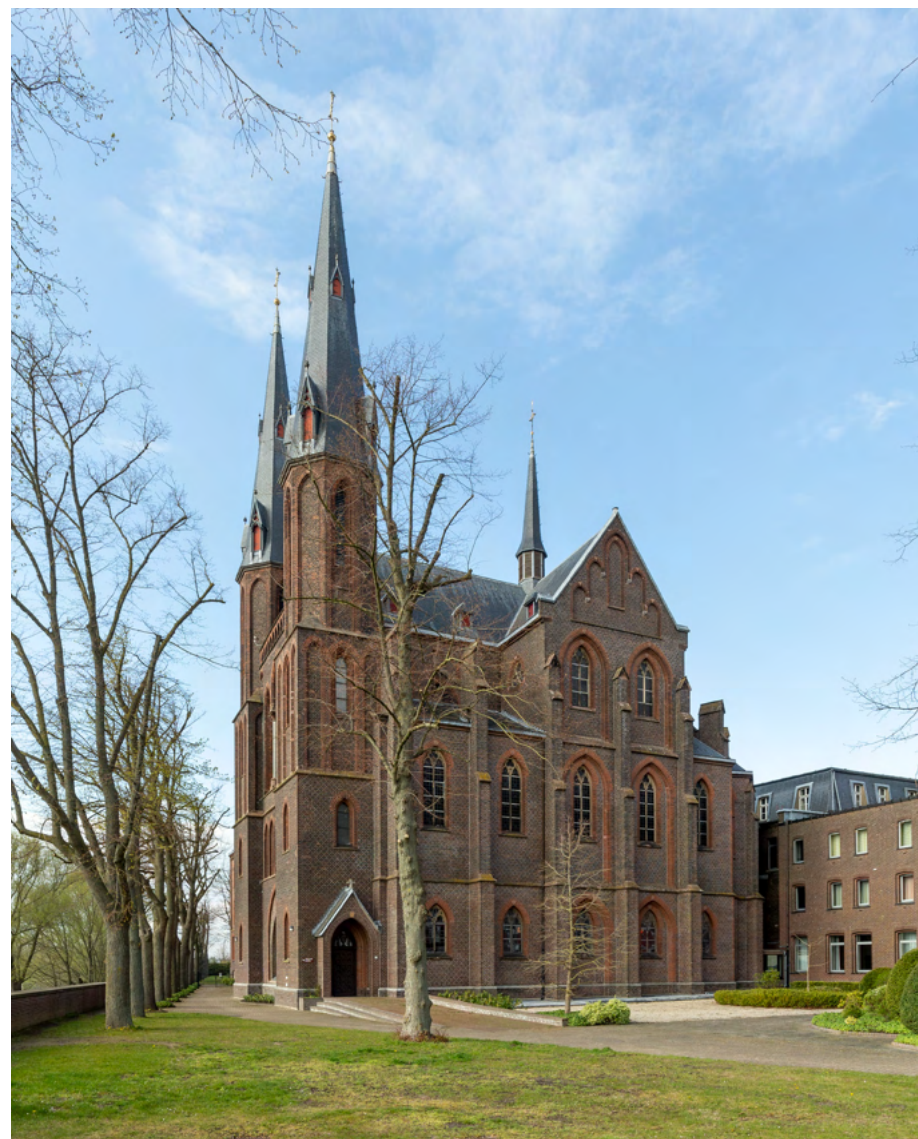
De dubbelkerk van Missiehuis Sint-Michael in Steyl.