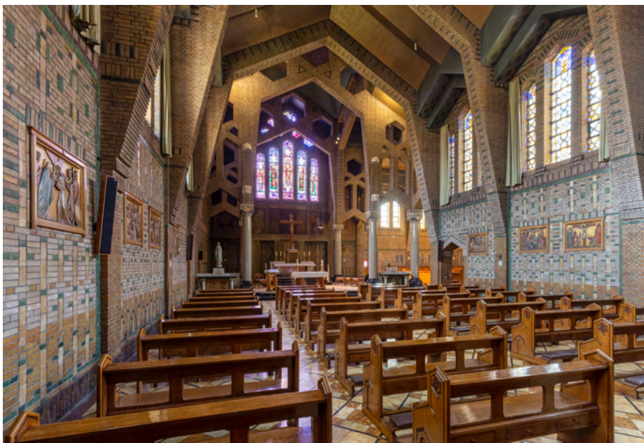
Kapel Mariadal in Roosendaal, gebouwd in een L-vorm.

tussen kloosterlingen en gasten. Moest bij ziekte een arts in het slot zijn, dan werd hij door een kloosterling begeleid.