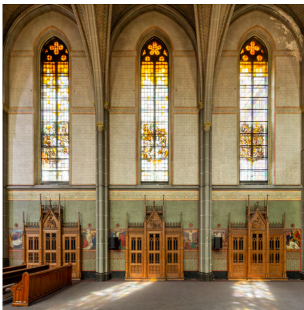
Zijaanzicht van de schiptraveeën met per travee een eenduidige opbouw bestaande uit een biechtstoel geflankeerd door kruiswegstaties en daarboven een hoog, smal venster met beschilderd glas-in-lood.