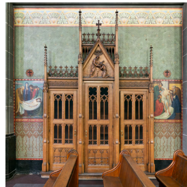
Een van de zes fraaie eikenhouten biechtstoelen in neogotische vormgeving gemaakt door het atelier J.W. Ramakers & Zonen uit Geleen. F.C. de Beer, huisarchitect van de paters, leverde het ontwerp.