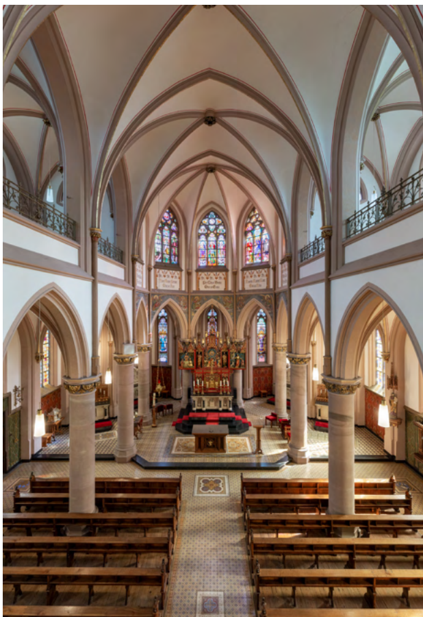
Interieur van de bovenkerk van het Missiehuis Sint-Michael te Steyl. De vijf glas-in-loodvensters bovenin het koor verwijzen naar de vijf continenten, het werkteerrein van de kloostergemeenschap.

er de verheerlijking van het Lam Gods. Geschilderde engelen richten zich op het altaar, in de straalkapellen zijn het gebrandschilderde engelen met Duitse tekstregisters. En overal zijn de wanden verlevendigd met geschilderde draperieën: groen in het schip en rood en goud bij de altaren. Er is dus een opgaande lijn, met het hoogaltaar als climax. Het is een en al kleurenrijkdom, badend in het licht dat door de kerkraden binnenvalt.