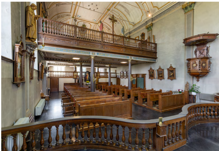
Zicht vanuit het koor op de bovenverdieping met nonnenkoor.

De dubbele opzet is karakteristiek voor de ontwikkelingen vóór de negentiende eeuw. 9 Al in de dertiende eeuw kwamen dubbelkapellen voor, toen nog bij mannenkloosters. Al vrij snel werd deze opzet karakteristiek voor de vrouwenkloosters. Sommige negentiende- en twintigste-eeuwse kloosterkapellen hebben eveneens een hoger gelegen bidruimte of kapel met zicht op het altaar (zoals een ziekenkapel). Deze ruimten bevinden zich echter niet in de kerkruijme zelf, maar in aansluitende bouwdelen. Een uniek voorbeeld is het kapellenensemble in het moederhuis van de Zusters van Liefde in Tilburg, waar op de hoofdkapel afzonderlijke kapellen voor novicen, postulanten en weeskinderen aansluiten. De vroegere kapel van de Zusters van het Arme Kind Jezus in Maastricht (Boschstraat) uit omstreeks 1900 moet een nonnenkoor hebben gehad, zoals in de middeleeuwen. Benden zaten de kostschoolmeisjes. Rond 1900 was zo'n opzet evenwel ongewoon.