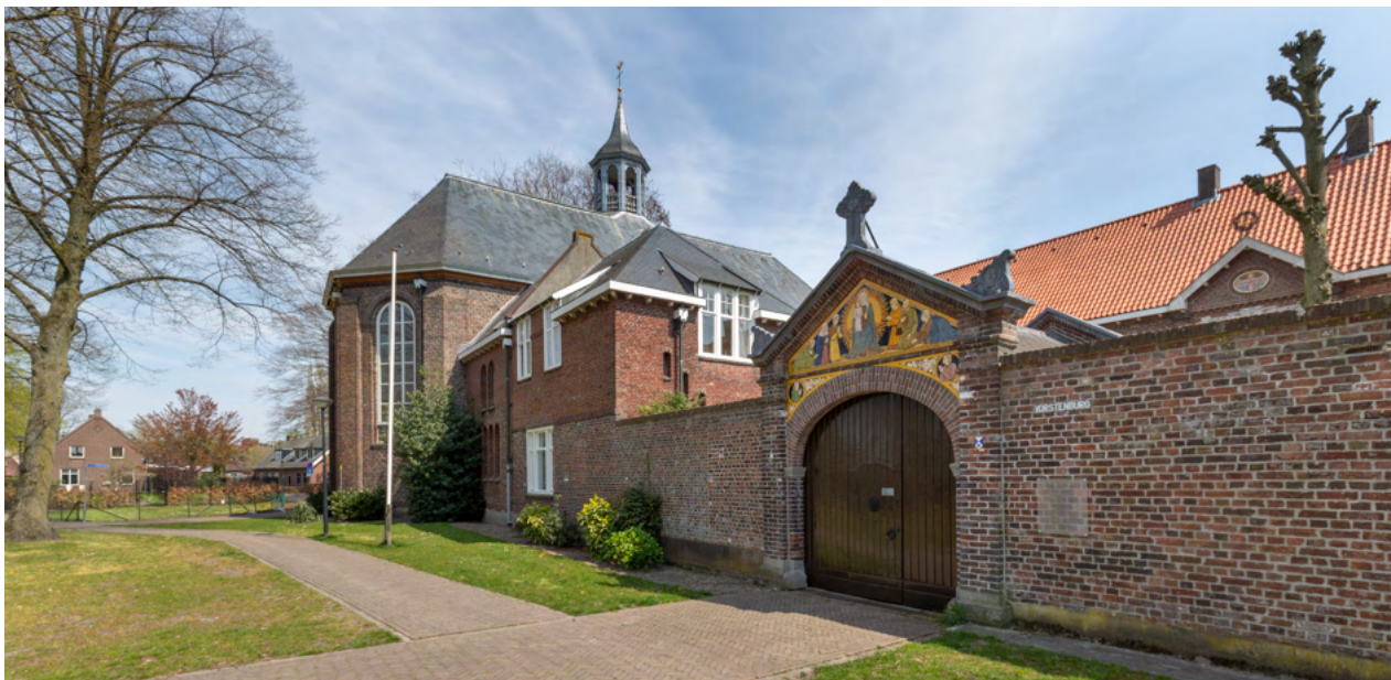
Ingang van de abdij. Boven de poort een negentiende-eeuws tegeltableau met een voorstelling van Maria, de toevlucht der bedrukten .