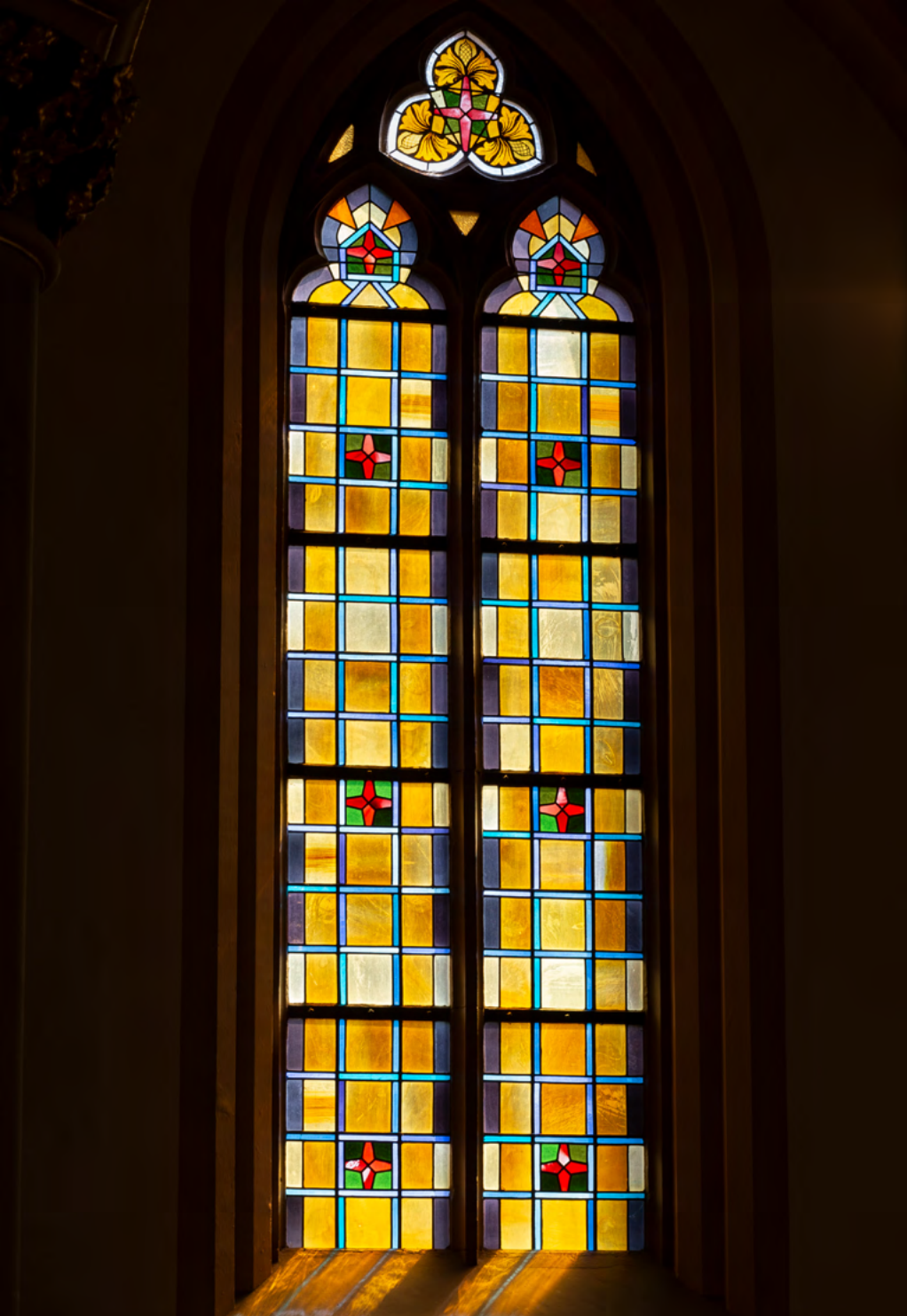
Glas-in-loodraam met geometrische patronen in de kloosterkerk te Steyl.