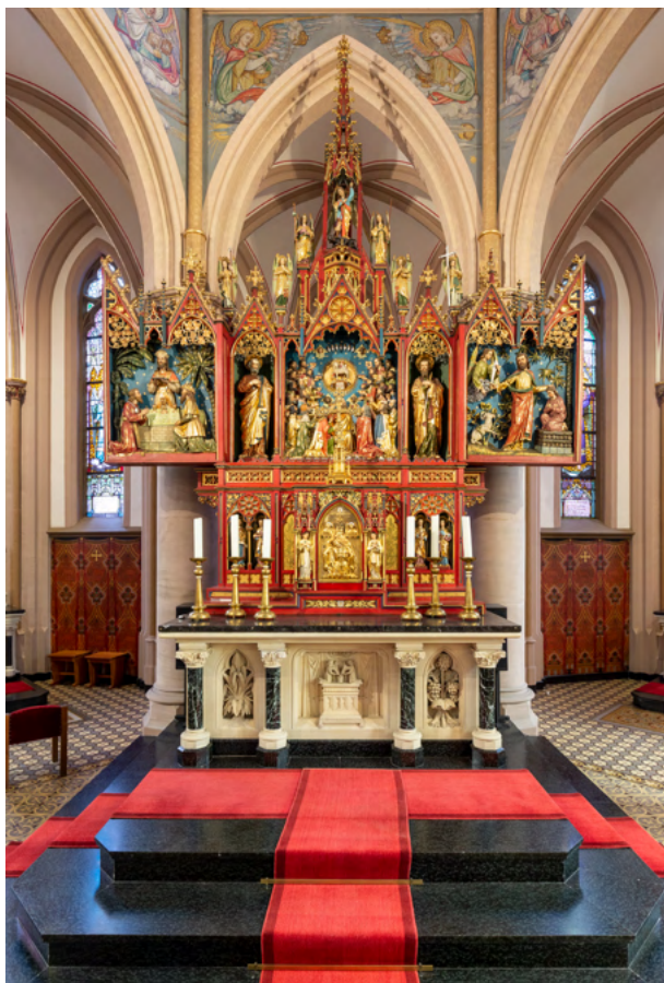
Kleurrijk neogotisch vleugelaltaar, vervaardigd in 1883 door het atelier J.W. Ramakers & Zonen te Geleen.