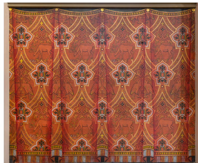
Wandschildering met draperieën in rood en goud in het koor van de bovenkerk te Steyl.